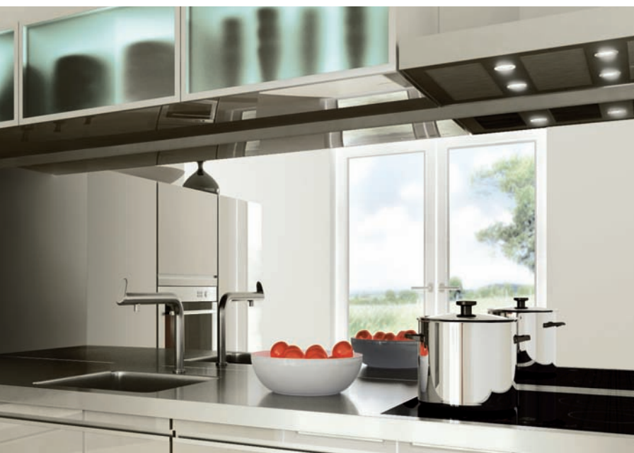
sgg MIRASTAR als Einscheibensicherheitsglas ESG für die hygienische Anwendung in Küchen

* Empfehlung ist ein Lichtverhältnis zwischen den Räumen von 1:8 Lux