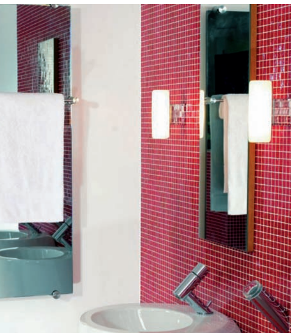
SGG MIRASTAR als Wandheizkörper SGG THERMOVIT elegance mit Handtuchhalter