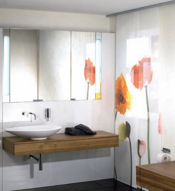
SGG MIRASTAR als feuchtraumbeständiger Chromspiegel im Nassbereich